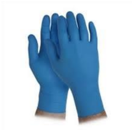
Guanti in nitrile

Per favorire lo svolgimento dell'esame agli alunni con disabilità certificata sarà consentita la presenza di eventuali assistenti (es. OEPA, Assistente alla comunicazione); in tal caso per tali figure, non essendo possibile garantire il distanziamento sociale dallo studente, è previsto l'utilizzo di guanti in nitrile oltre la consueta mascherina chirurgica.